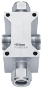
Für flüssige Medien

H-Zelle mit hochpräziser Schichtdicken Genauigkeit (2 mm, 5 mm oder 10 mm)